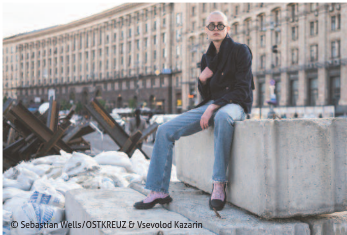
© Sebastian Wells/OSTKREUZ & Vsevolod Kazarin

über die Ausstellung und die aktuelle Menschenrechtslage